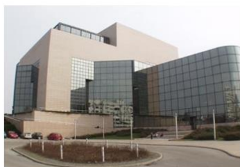
"Panteon hrvatske knjige"