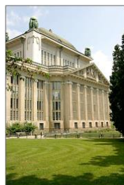
"Secesijska ljepotica" sagrađena 1913.g.