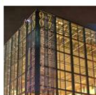
NSK osnovana 1607.g. - 2007.g. proslava 400. obljetnice